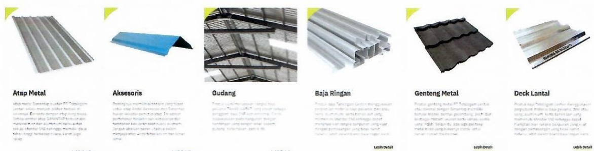
Gambar 2. Produk yang dihasilkan oleh Tatalogam Lestari

PT Tatalogam Lestari merupakan perusahaan nasional Indonesia yang bergerak di bidang industri bahan bangunan, khususnya sebagai produsen dan distributor rangka atap baja ringan, genteng metal, dan panel logam. Berdiri sejak tahun 1994, perusahaan ini dikenal melalui sejumlah merek produk unggulan seperti “Sakti Roof”, “Taso”, dan “Jalusi” (Tatalogam.com, 2025). Dengan jaringan distribusi luas dan pabrik modern, Tatalogam Lestari telah menjadi salah satu pelaku utama dalam sektor konstruksi ringan di Indonesia. Pada tahun 2021, perusahaan ini mendaftarkan merek “JOLIBI” untuk produk kelas 6 yang mencakup bahan bangunan logam.