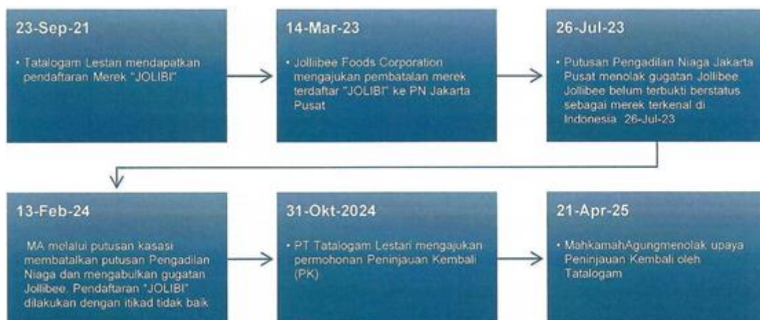
Gambar 4. Linimasa Sengketa Merek Jollibee

Linimasa - Kronologi sengketa merek “JOLLIBEE” vs “JOLIBI” (berdasarkan Putusan MA No. 172 K/Pdt.Sus-HKI/2024 dan dokumen pengadilan terkait):